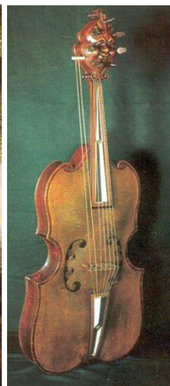
viola da gamba https://www.youtube.com/watch?v=YvpU3UYtVml

Tra i “dilettanti” lo strumento preferito è il liuto, grazie anche alla relativa facilità di esecuzione e al fatto di valersi di una notazione semplificata, l’intavolatura. Questa consiste nel riprodurre la cordiera mediante un tracciato di linee sulle quali numeri o lettere alfabetiche indicano la posizione delle dita del liutista. Completano al grave la “famiglia” gli “arciliuti”, il chitarrone e la tiorba, provvisti di corde aggiuntive più lunghe, ospitate da un secondo cavigliere collocato più in alto.