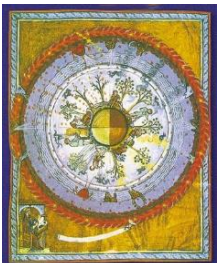
Figura tra le più interessanti dell'intero medioevo, fu badessa benedettina, poetessa e compositrice dalla cultura enciclopedica e dalla personalità originale e anticonformista. In Symphonia harmonie celestium revelationum sono comprese circa ottanta sue melodie. Ildegarda è pure autrice di una "Sacra rappresentazione", l' Ordo Virtutum (1152) che comprende oltre ottanta melodie su testi in latino, in versi e in prosa, tutti di sua invenzione. Da ricordare inoltre due suoi trattati, uno medico e uno botanico.

O VIS AETERNITATIS http://www.youtube.com/watch?feature=player_detailpage&v=ef70x-TU0NY